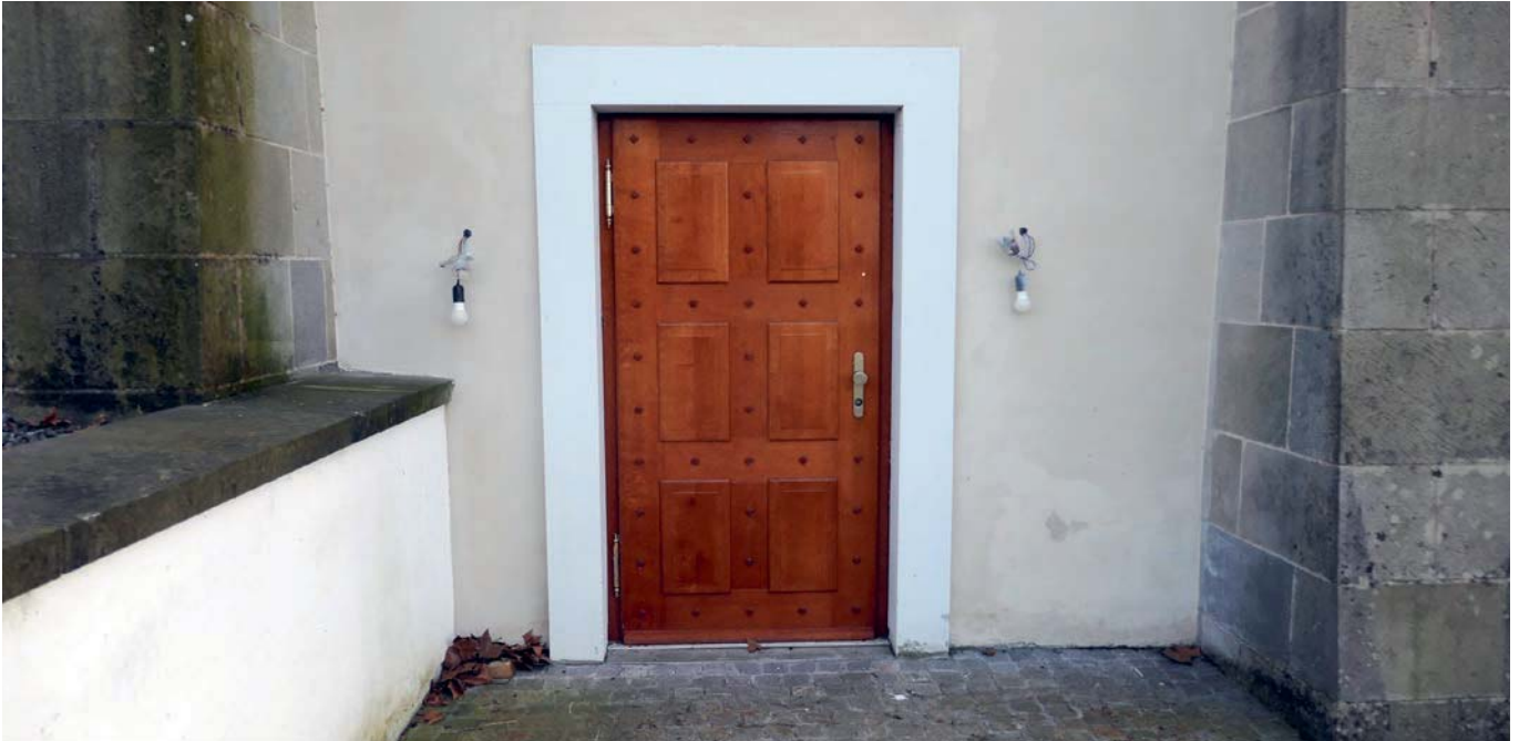
Irgendwie scheint die Kapelle beim Salesianum in Vergessenheit geraten zu sein.