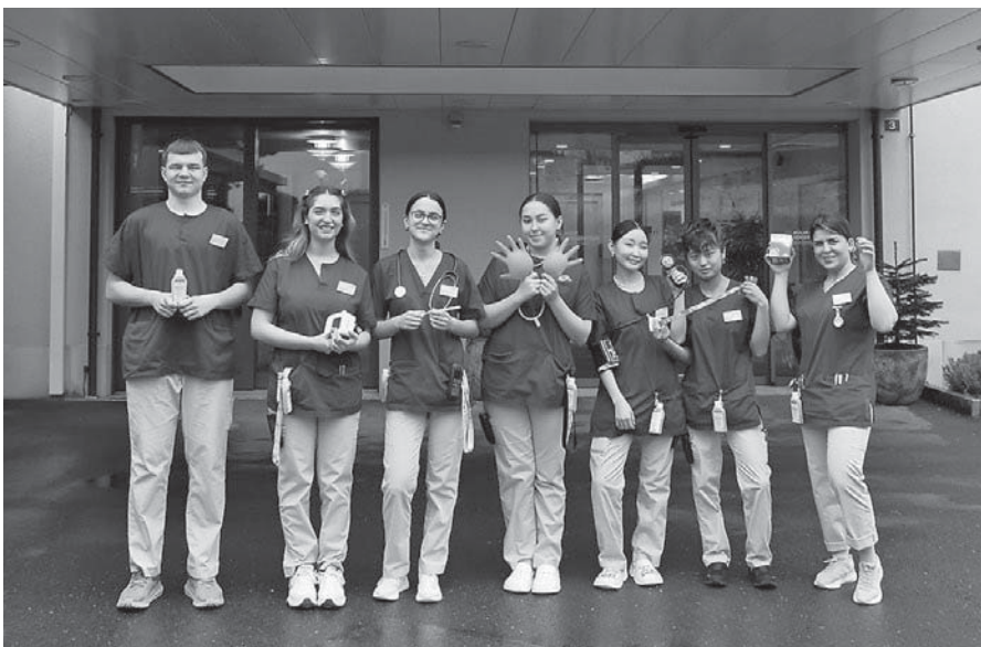
Lernende und Studierende diverser Ausbildungs- und Studienjahre